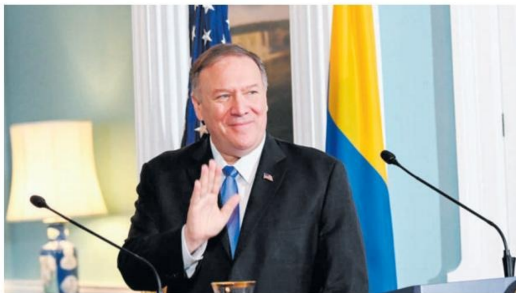
nde e menasa," Pompeo "Nos lo traha pa sigura cu añadi. EI no tin su califato," el a ta indica.

"Esey ciertamente loke mi no ta kere cu lo pasa. Mi ta confia cu e presidente Trump ta compro-